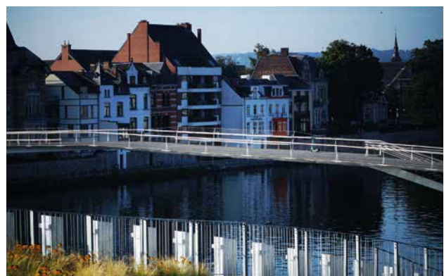
DE VOETGANGERS- EN FIETSERSBRUG: L'ENJAMBÉE

De onderzoeken werden gevoerd door de stad Namen en toevertrouwd aan het kantoor Greisch. De werken werden uitgevoerd door de openbare dienst van Wallonië, DGO2-directie van bevaarbare wegen.