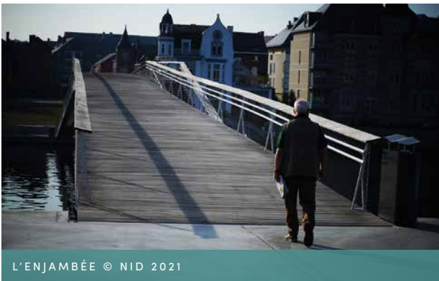
L'ENJAMBÉE © NID 2021

Aan de kant van Jambes wordt naast de voetgangersbrug een openbaar plein aangelegd, ook voorzien in het gemeentelijk plan van 1962. Het plein, dat Square de la Francophonie werd genoemd, wordt in het zuiden begrensd door de rue Mazy, in het noorden door de Maas en in het oosten en westen door de muurtjes van de aangrenzende eigendommen.