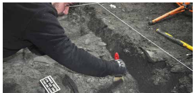
DE OPGRAVINGEN OP DE CONFLUENCE-SITE

De wetenschappelijke exploitatie van de gegevens (post-opgraving) vond plaats in de nasleep van het veldwerk, ter voorbereiding van de publicatie van de resultaten.