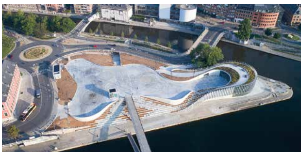
DE SITE VAN DE CONFLUENCE