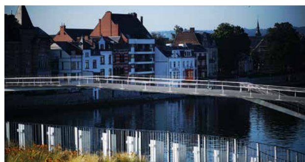
LA PASSERELLE CYCLO-PIÉTONNE : L'ENJAMBÉE

Le permis d'urbanisme a été délivré le 6 décembre 2016 ce qui a permis aux travaux de débuter en février 2017 par la démolition des maisons expropriées et le déplacement des impétrants. En août 2018, l'entrepreneur Franki a procédé à la rotation