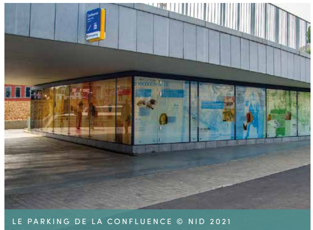
LE PARKING DE LA CONFLUENCE

Ce parking s'inscrit également dans la stratégie globale de la Ville de Namur qui apparaît dans son Schéma de Structure Communal (2012) aujourd'hui appelé Schéma de Développement Communal et dans son Plan Communal de Mobilité (actualisé en 2018).