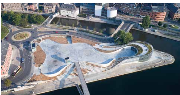
LE SITE DE LA CONFLUENCE