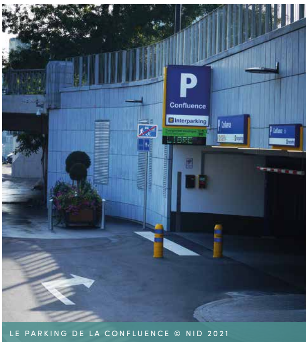
LE PARKING DE LA CONFLUENCE

Cette infrastructure , inaugurée le 30 juin 2021, est dotée de technologies récentes qui rendent plus agréable l'expérience du visiteur : ascenseurs, système de purification d'air, reconnaissance de plaques, emplacements motos et vélos, consignes, aide au stationnement, bornes de recharge pour véhicules électriques, la possibilité de réserver son emplacement en ligne et de bénéficier de tarifs avantageux notamment en soirée avec la carte gratuite Pcard , etc.