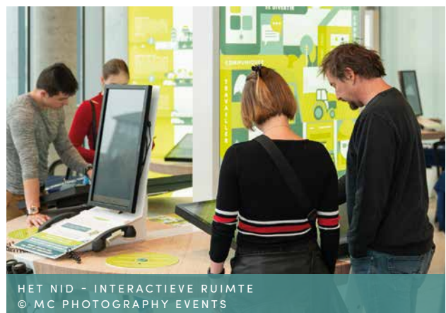
HET NID - INTERACTIEVE RUIMTE

Door een simulatiespel ontwikkelt u mee de infrastructuren die noodzakelijk zijn voor de goede werking van de stad (supermarkt, wegen, openbaarvervoersnetwerk, recyclagepark enz.).