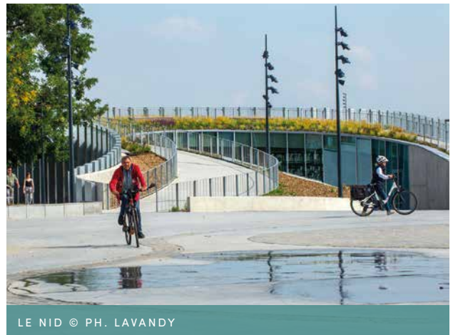
LE NID