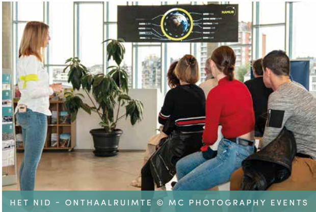
HET NID - ONTHAALRUIMTE

Als het de steden zijn die deze wereldwijde problemen veroorzaken, kunnen alleen zij hier oplossingen voor vinden. Het is meer dan ooit noodzakelijk om de reikwijdte van dit potentieel voor verandering in steden te vatten. Om te zorgen voor een redelijke levensstandaard voor bewoners, de sociale samenhang te behouden en ons een gezamenlijke aantrekkelijke toekomst voor te stellen, gaat het erom onze steden democratisch voor te bereiden om de milieu- en economische invloeden die zich voordoen te absorberen.