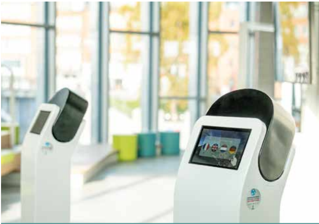
HET NID - DE GRENZEN VAN VIRTUELE REALITEIT © S. ROBERTY