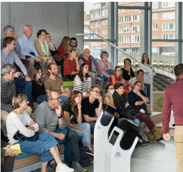
HET NID - RUIMTE TOEGEWIJD AAN DEBATTEN

Deze ruimte is toegewijd aan debatten, ideeënuitselingen enz. Ze nodigt actoren uit de stad uit om elkaar te ontmoeten en te debatteren over de problematieken die worden aangekaart in het NID.