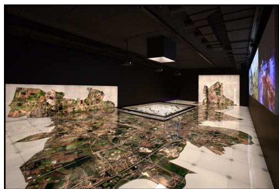
Gand, Stad Museum, plancher constitué d'orthophotoplans.