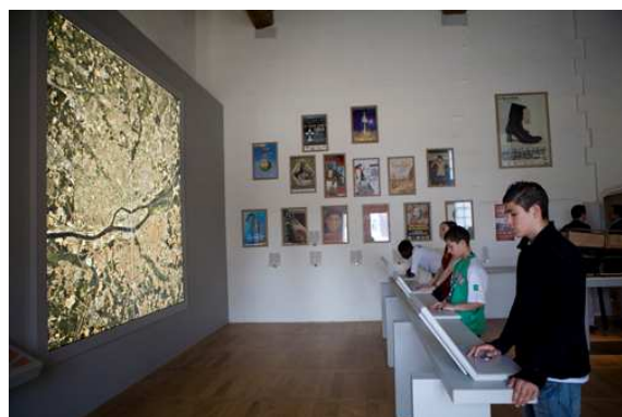
Nantes, Musée d'histoire urbaine, bornes multimédia.

Le Pavillon de l'Aménagement Urbain est un outil pour créer une dynamique de dialogue et de participation entre les autorités publiques, les acteurs de terrain et le grand public (en ce compris les enfants). Ces matières complexes seront rendues accessibles et attractives au travers d'évènements ludiques et pédagogiques.