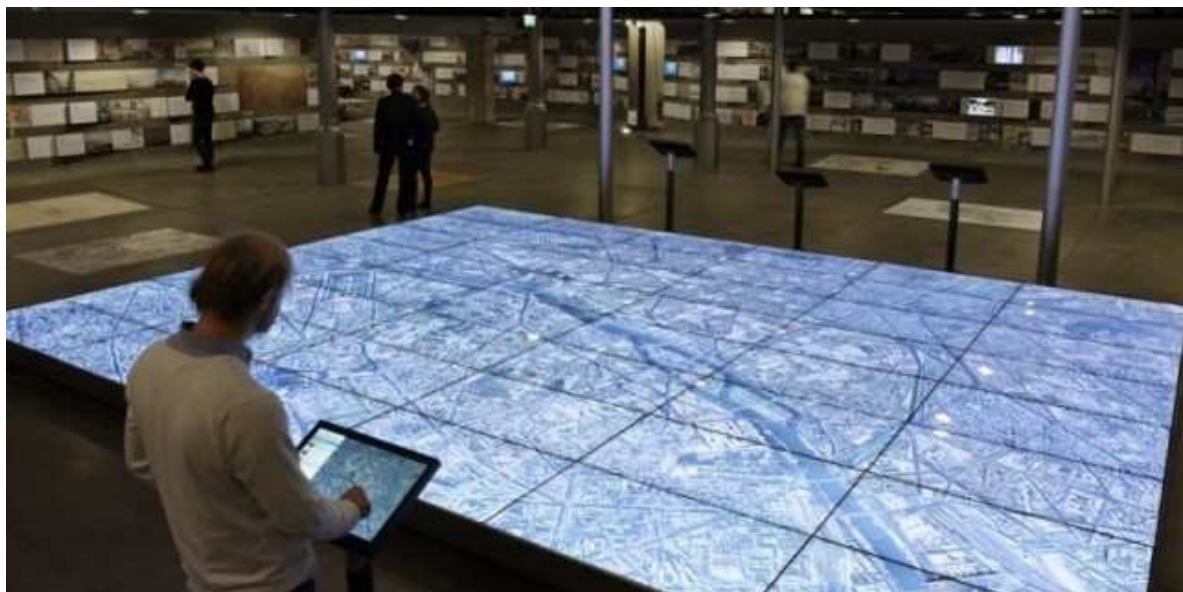
Paris, Pavillon de l'Arsenal, Maquette 3D géante, « Paris, la métropole et ses projets ».