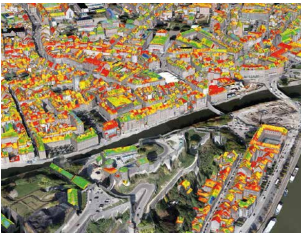
THERMOGRAPHIE AÉRIENNE - SUD DE LA CORBEILLE ET RUE NOTRE DAME

Les outils de thermographie aérienne et de Namur 3D illustrent l'expertise que peut apporter le NID. Ces technologies ont permis, par exemple, de calculer le potentiel photovoltaïque de toutes les toitures namuroises et, ce faisant, d'évaluer quel pourrait être la part de l'énergie solaire pour atteindre les objectifs de réduction d'émissions carbone.