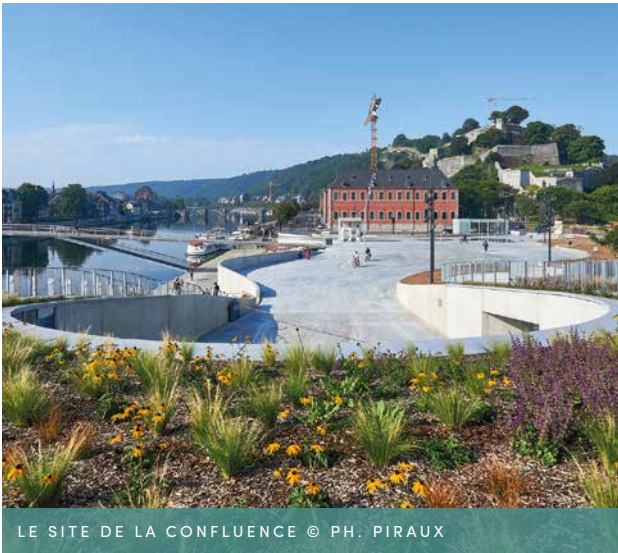
LE SITE DE LA CONFLUENCE