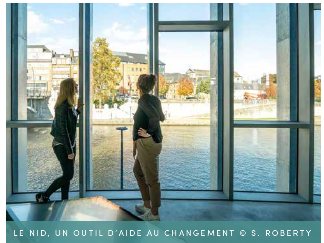
LE NID, UN OUTIL D'AIDE AU CHANGEMENT

Cependant, l'urgence est bien là ! Le rôle du NID est de renvoyer chacun·e à ses responsabilités et de tisser des convergences pour que les réponses aux défis soient portées par toutes et tous et pour toutes et tous.