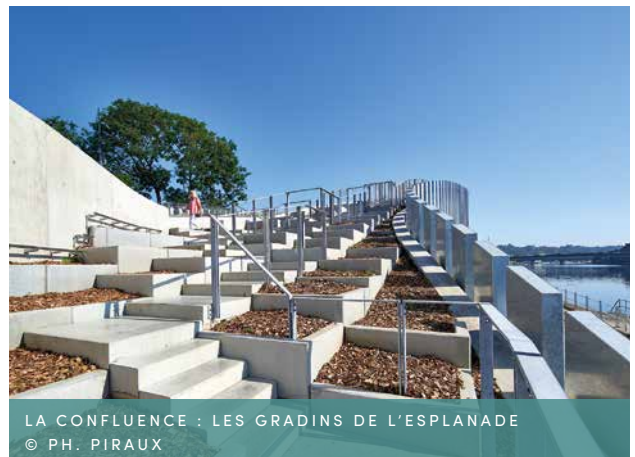
LA CONFLUENCE : LES GRADINS DE L'ESPLANADE