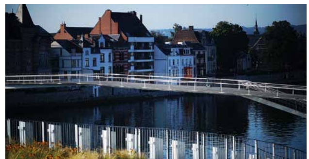
LA PASSERELLE CYCLO-PIÉTONNE : L'ENJAMBÉE

Le permis d'urbanisme a été délivré le 6 décembre 2016 ce qui a permis aux travaux de débuter en février 2017 par la démolition des maisons expropriées et le déplacement des impétrants. En août 2018, l'entrepreneur Franki a procédé à la rotation