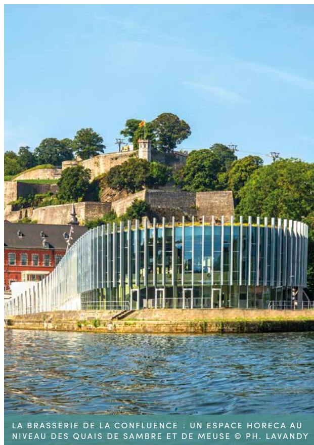
LA BRASSERIE DE LA CONFLUENCE : UN ESPACE HORECA AU NIVEAU DES QAIS DE SAMBRE ET DE MEUSE

Dans ce lieu, il est proposé une carte locale, de saison et durable pour tous les goûts et tous les âges.