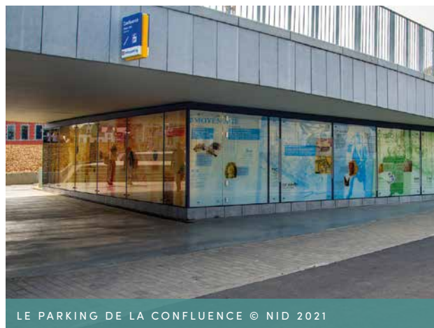
LE PARKING DE LA CONFLUENCE

Ce nouveau parking s'inscrit dans la stratégie globale de la Ville de Namur qui apparaît dans son Schéma de Structure Communal (2012) aujourd'hui appelé Schéma de Développement Communal et dans son Plan Communal de Mobilité (actualisé en 2018).