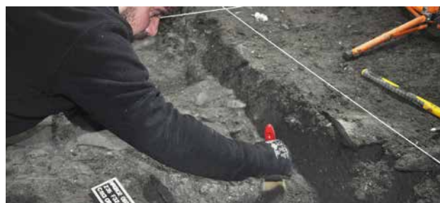
LES FOUILLES SUR LE SITE DE LA CONFLUENCE

L'exploitation scientifique des données (post-fouilles) a été entreprise dans la foulée des recherches de terrain, en préparation à la publication des résultats.