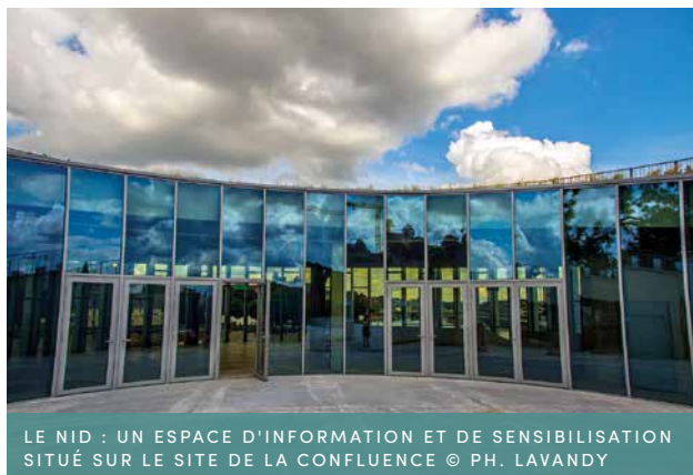
LE NID : UN ESPACE D'INFORMATION ET DE SENSIBILISATION SITUÉ SUR LE SITE DE LA CONFLUENCE

Le NID est amené à accompagner une révolution vers un territoire intelligent et durable, c'est-à-dire favorisant la transition écologique tout en étant à la fois connecté, intelligent, plus respectueux de l'environnement et offrant toujours plus de services aux citoyen·ne·s.