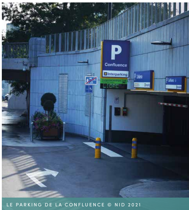
LE PARKING DE LA CONFLUENCE

Cette toute nouvelle infrastructure , inaugurée le 30 juin 2021, est dotée de technologies récentes qui rendent plus agréable l'expérience du visiteur : ascenseurs, système de purification d'air, reconnaissance de plaques, emplacements motos et vélos, consignes, aide au stationnement, bornes de recharge pour véhicules électriques, la possibilité de réserver son emplacement en ligne et de bénéficier de tarifs avantageux notamment en soirée avec la carte gratuite Pcard , etc.