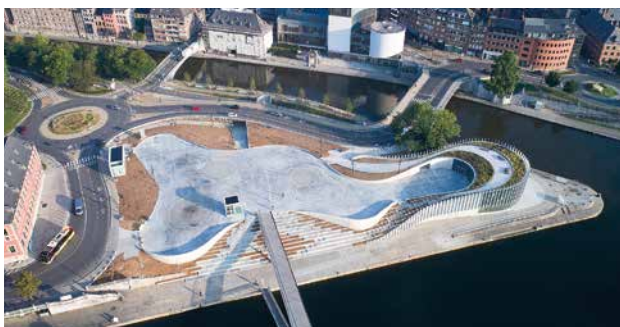
LE SITE DE LA CONFLUENCE