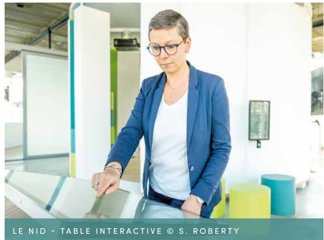
LE NID - TABLE INTERACTIVE

Vous êtes confronté à une problématique et plusieurs actions vous sont proposées. Tentez d'allier résilience et reliance et validez votre choix.