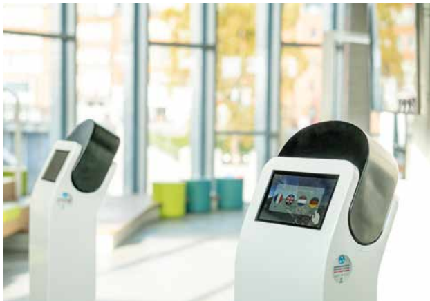
LE NID - LES BORNES DE RÉALITÉ VIRTUELLE