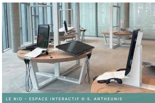
LE NID - ESPACE INTERACTIF

Au travers notamment d'un jeu de simulation vous êtes amené à développer les infrastructures nécessaires au bon fonctionnement d'une ville (supermarché, voiries, réseaux de transports en commun, recycparc, etc.).