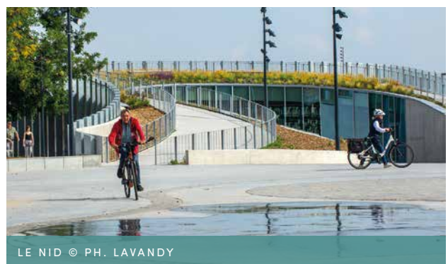
LE NID

Application et respect des mesures sanitaires en vigueur.