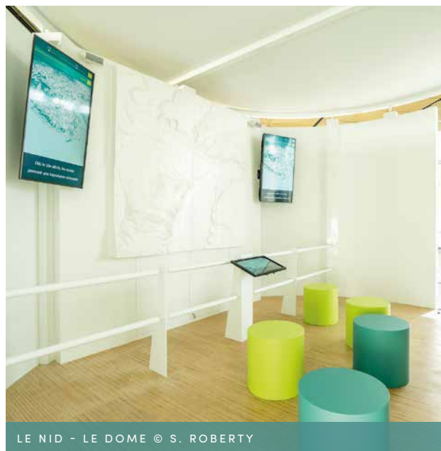
LE NID - LE DOME

Placez-vous à l'intérieur d'un dôme et découvrez pendant 10 minutes l'évolution urbaine de Namur, ses problématiques et solutions, en s'appuyant sur les concepts de durabilité et d'intelligence (qu'elle soit humaine ou artificielle).