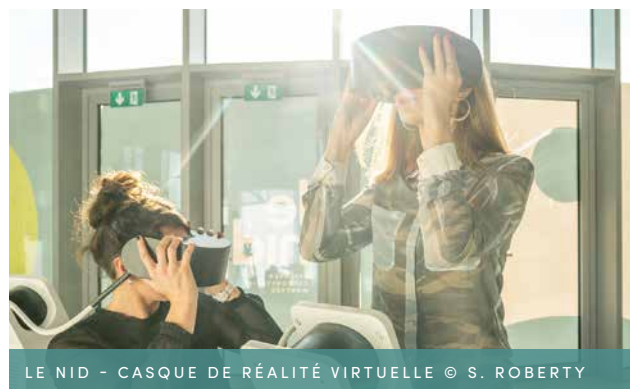
LE NID - CASQUE DE RÉALITÉ VIRTUELLE