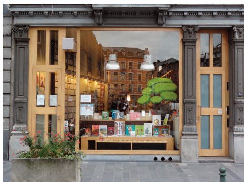
© Département de l'urbanisme de la Ville de Liège

De toute manière et en particulier lorsque les travaux sont réalisés par phases, l'accès privatif doit impérativement être créé au cours de la phase initiale de travaux.