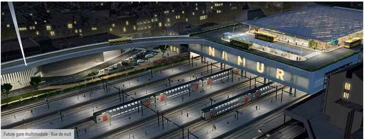
Future gare multimodale - Vue de nuit

Les projets prévus pour cette réhabilitation sont multiples :