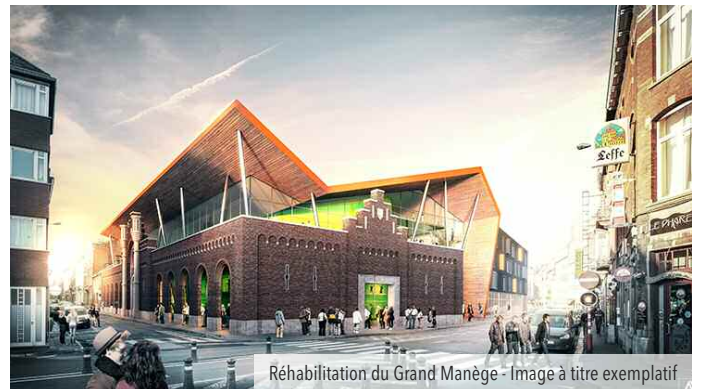
Réhabilitation du Grand Manège - Image à titre exemplatif

Juste à côté, l'Espace Rogier accueillera lui aussi un nouveau projet d'envergure où se mêleront tous les aspects de la vie namuroise de par la présence de logements, de bureaux et d'infrastructures culturelles grâce à l'implantation du Conservatoire et à la rénovation du Grand Manège. L'ensemble sera réalisé dans une architecture urbaine contemporaine et de qualité.