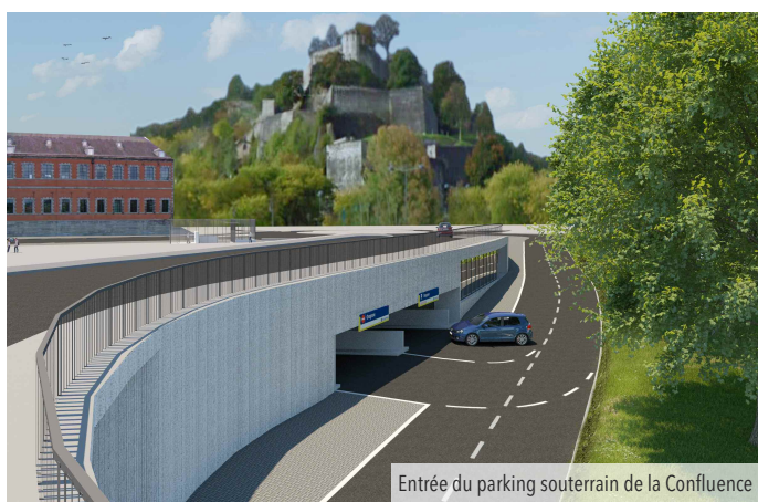
Entrée du parking souterrain de la Confluence

- la création d'un parking souterrain de 747 places (hors FEDER).