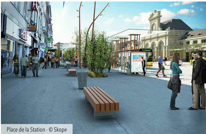
Place de la Station - © Skope

Cette dynamique engendrée par la réhabilitation du quartier de la gare marque une étape décisive vers une ville plus accessible et plus attractive.