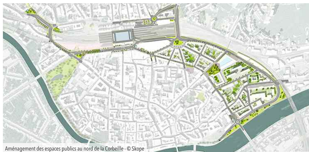
Aménagement des espaces publics au nord de la Corbeille

La gare de Namur constitue une des principales portes d'entrée du territoire et est un vecteur important de son rayonnement. Défendre l'attrait de la ville et la réinvestir, y compris dans sa dimension commerciale, c'est prémunir ses habitants d'une forme d'abandon urbain et c'est offrir à tous un cadre plus agréable pour mieux vivre ensemble. Pour cette raison, la Ville a mis en place un vaste programme de réhabilitation du nord de la Corbeille.